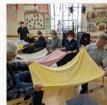
レクリエーション